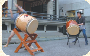
昨年の笑店街の様子